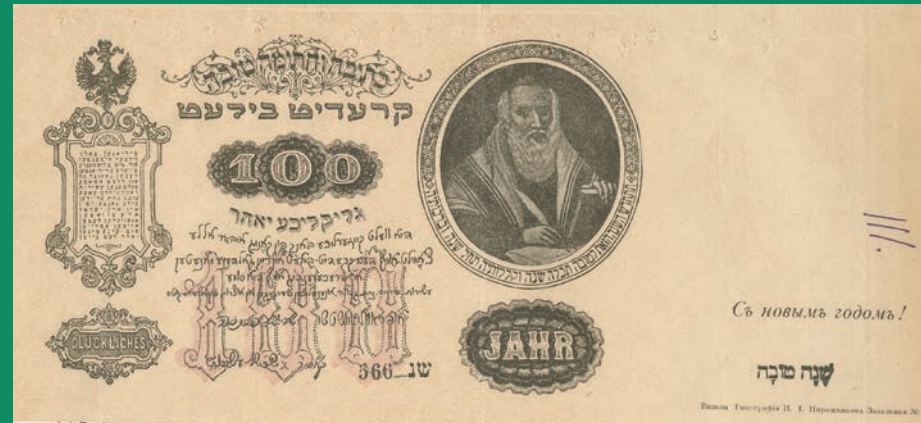
Naujametis sveikinimo lapelis, vaizduojantis 100 rublių kredito bilieta, su Vilniaus Gaono atvaizdu. Vilnius, 1907 m.

Į Vilnių Elijas grįžo tik 1745-aisiais, po penkerius metus trukusių klajonių. Likusią gyvenimo dalį Vilniaus Gaonas gyveno ir kūrė Vilniuje. Išminčius buvo labai reiklus sau, gyveno atsidėdamas vien darbui – šventų raštų studijoms, jo butis buvo asketiška. Dėl savo tikslo Gaonas buvo visiškai nutolęs nuo šeimos reikalų, todėl net jo laiškas su nurodymais šeimai (išlikęs iki mūsų dienų) atrodė tarsi mokslinis moralės dėsnių traktatas ir filosofijos kanonas. Kartu Vilniaus Gaonas buvo žinomas kaip teisuolis bei jautrus vargšams humanistas.