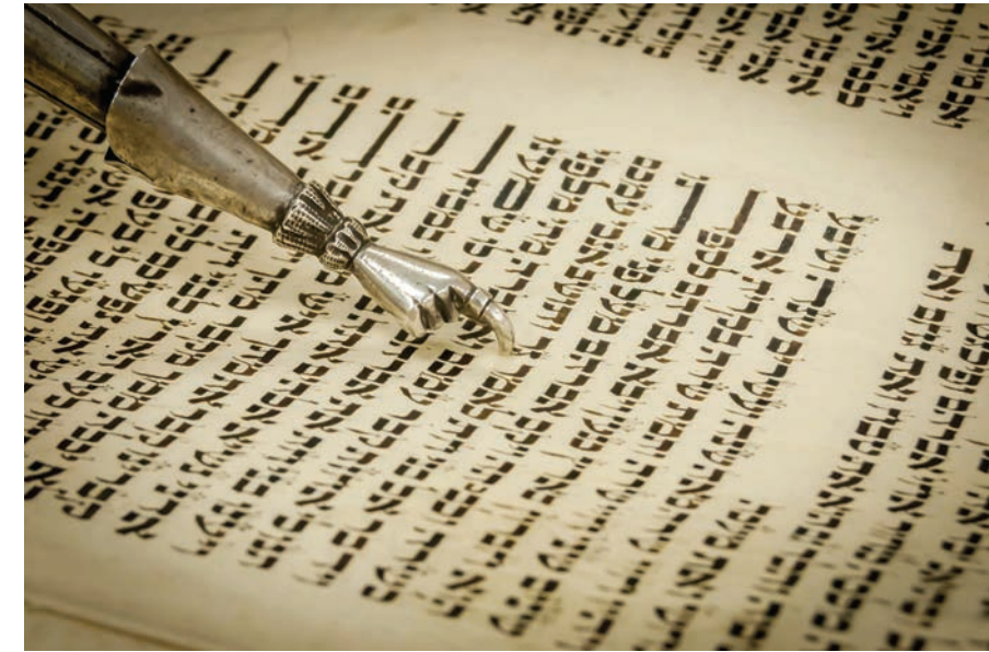
Jadas – pagalbinė šventųjų raštų skaitymo priemonė

Sklandė legendos, kad Gaonas dirba be poilsio, miega per parą vos keturis pusvalandžius – tris naktį ir vieną dienos metu, o žvalumui palaikyti po darbo stalu laiko dubenį, pripiltą ledinio vandens, į kurį, suėmus miegui, įmerkia kojas. Įnikęs į darbus, Išminčius, pasak legendų, tiesiog visiškai nejautė laiko, todėl jam pateiktą maistą kartais suvalgydavo, kai šis jau būdavo spėjęs sudžiūti („nes skonis nesvarbu – gyvenimo skonis yra mokymesi“). Nors dienotvarkė buvo labai griežta ir nuolatinis triūsas pareikalavo daug jėgų, Vilniaus Gaonas šį pasaulį paliko sulaukęs 77-erių (1797 m. spalio 9 d.).