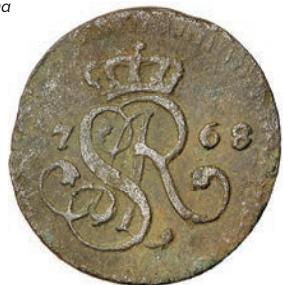
Vilniaus Gaono laikų monetos su viršutine dalyje vaizduojama karūna

Užrašai monetoje – keliomis kalbomis, parbrėžiant, kad Vilniaus Gaonas – pasaulinio masto figūra, svarbi ne vien Rytų Europos, bet ir pasaulio žydų bendruomenei.