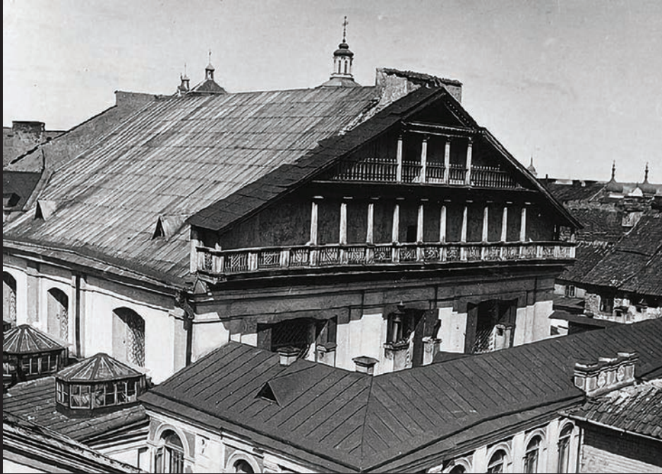
Vilniaus Didžioji sinagoga, pastatyta ant pirmosios sinagogos (1572) pamatu. Fotografuota I pasaulinio karo metu (1914–1918)